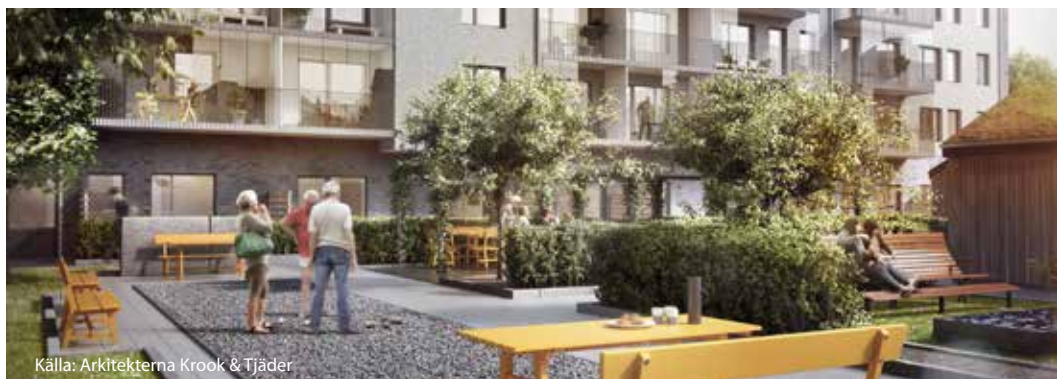
Källa: Arkitekterna Krook & Tjäder