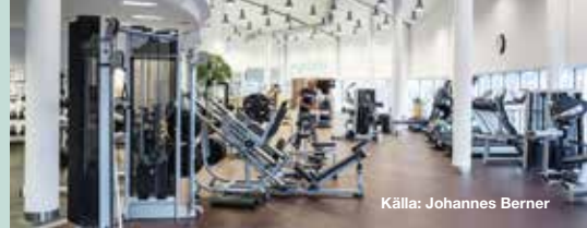
Källa: Johannes Berner