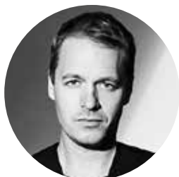
Marco Checchi Studio Stockholm