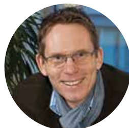
Jonas Hurtigh Grabe Veldhoen + Company